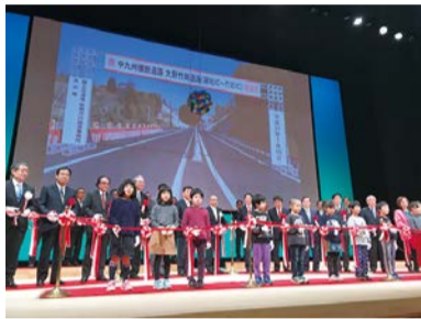
中九州横断道路 大野竹田道路開通式