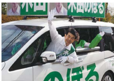
大分県議会議員選挙