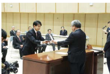
大分県議会議員選挙当選証書付与式