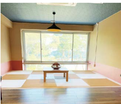
サテライトオフィス(国東市)

（答弁）姫島や国東、佐伯市でサテライトオフィスへの進出が実現した。県内には、リピーターの多い安心院の農村民泊など高いポテンシャルがあるため、新たな誘客への広がりが見込める。企業ニーズや働き方改革などを注視しながら、県外から企業や人を呼び込み、地方創生に繋げることが大事である。